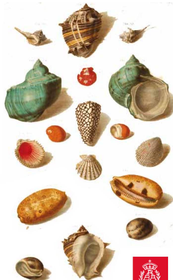
Imágenes de portada e interior: Lámina de gasterópodos Born